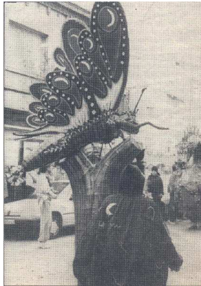
Inauguració de la Papallona de Sant Pere el 1992

Tot i que La Papallona va ser creada i presentada l'any 1992 no va ser fins un any després, l'any 1993, quan es va constituir de forma activa un grup de joves del barri de Sant Pere. L'AAVV de Sant Pere va cedir la Papallona a la colla disposada a promoure activitats relacionades amb la cultura i els barris. En un primer moment, el grup estava format per una quinzena de joves de diversos districtes de la ciutat de Terrassa i d'edats compreses entre els 14 i els 40 anys.